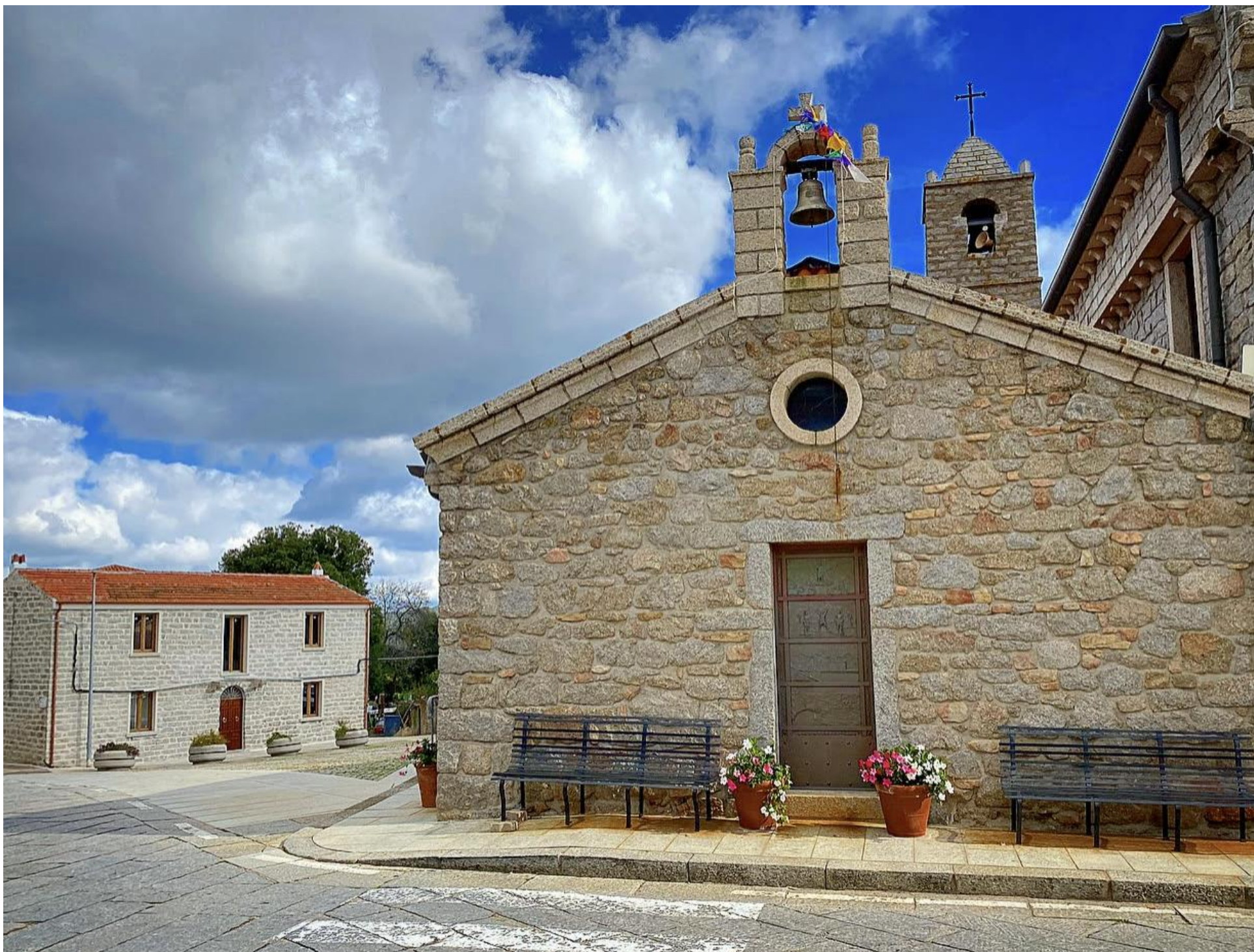
La gjesgia di Sant'Andria