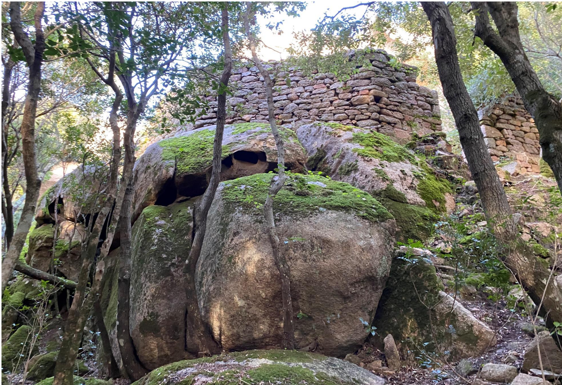
L'éremu medievali di Santu Santinu